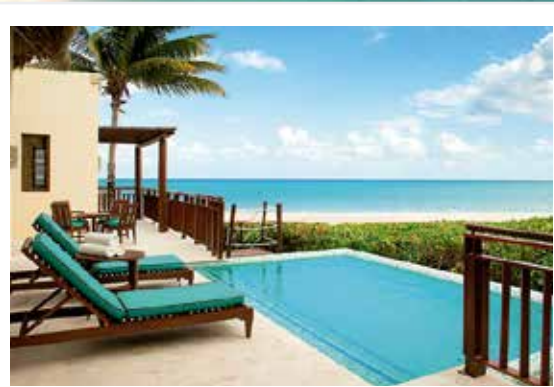
El Camaleón Mayakobá